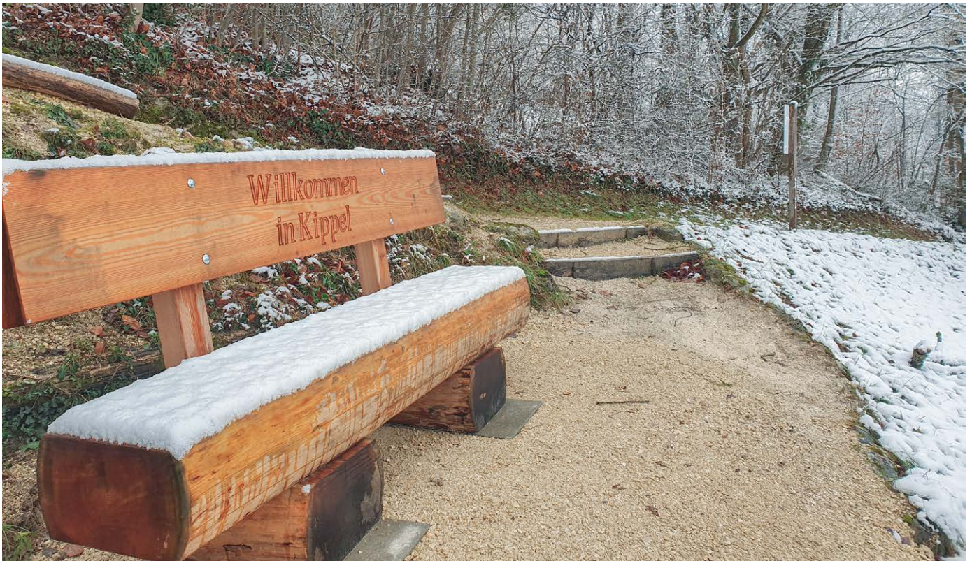
Kippeler Bank.